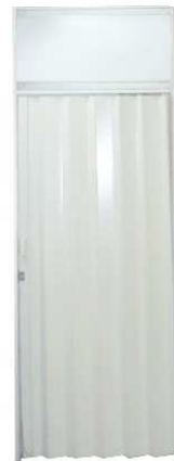
FOLDING DOOR 100x200 CM (SYSTEM BUILT)