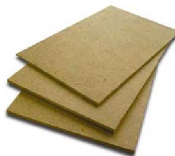
WOOD PLATFORM WITHOUT CARPET