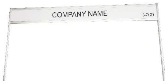
FASCIA BOARD WITH STANDARD LETTERING 10CM. HIGH 100x30 CM